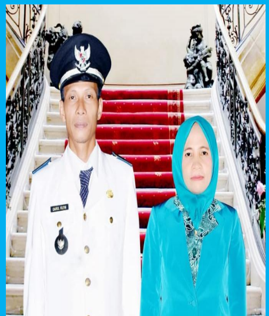
DARUL KUTNI Kepala Desa Suka Maju Kecamatan Rantau Alai